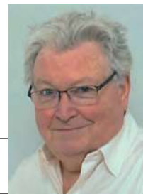
Modell, Text & Fotos: Helmut Rohrer